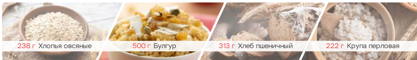
238 г Хлопья овсяные

Вес каждого продукта соответствует индивидуальному допустимому уровню потребления глютена.